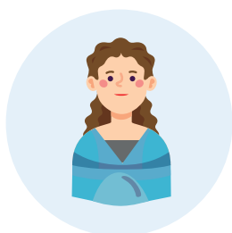
kobiety w ciąży