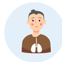
osoby z chorobami układu oddechowego i układu krążenia