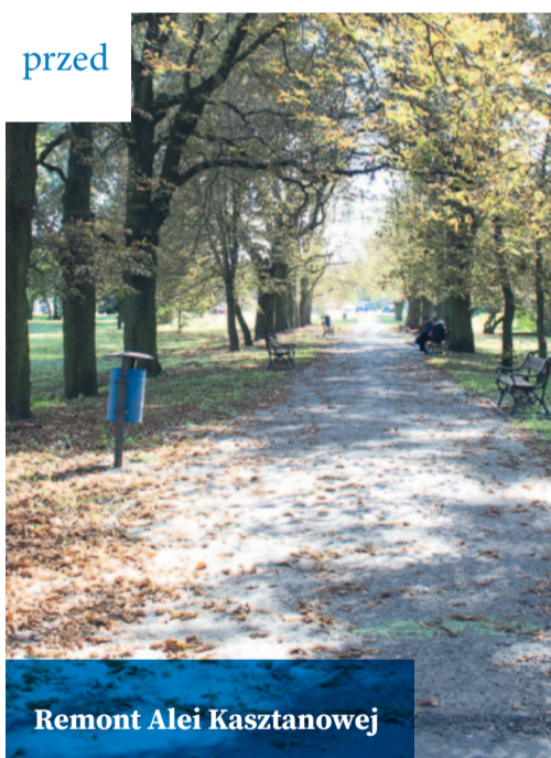
Remont Alei Kasztanowej