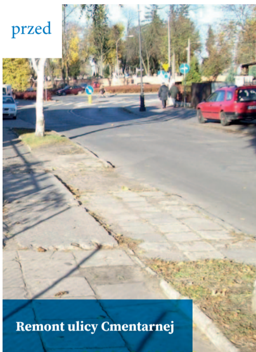
Remont ulicy Cmentarnej