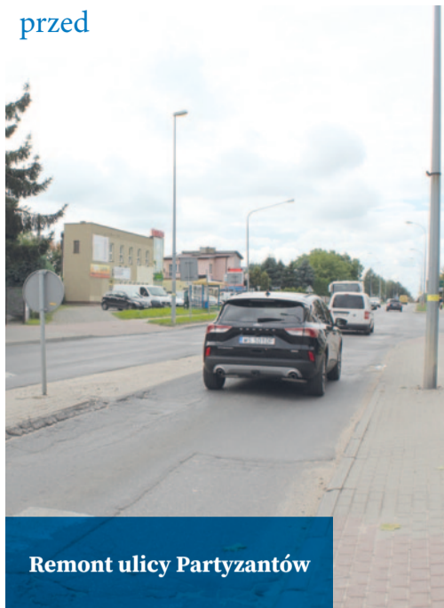
Remont ulicy Partyzantów