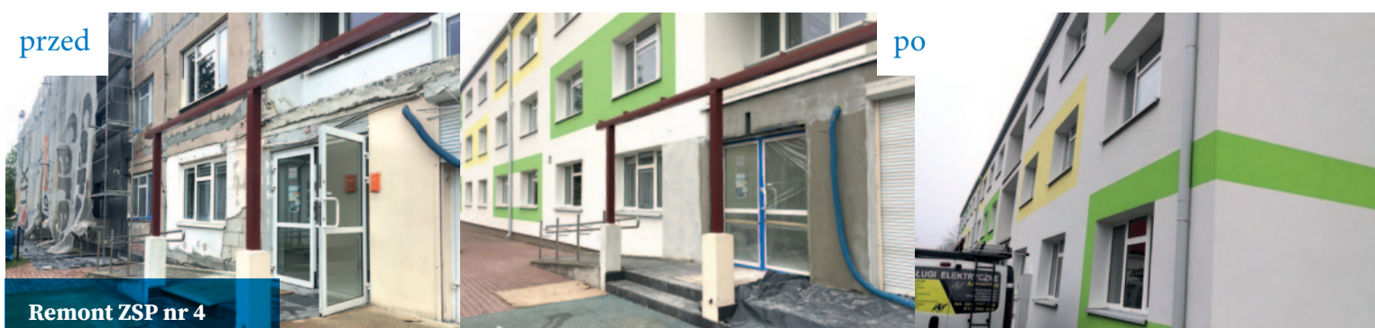
Remont ZSP nr 4