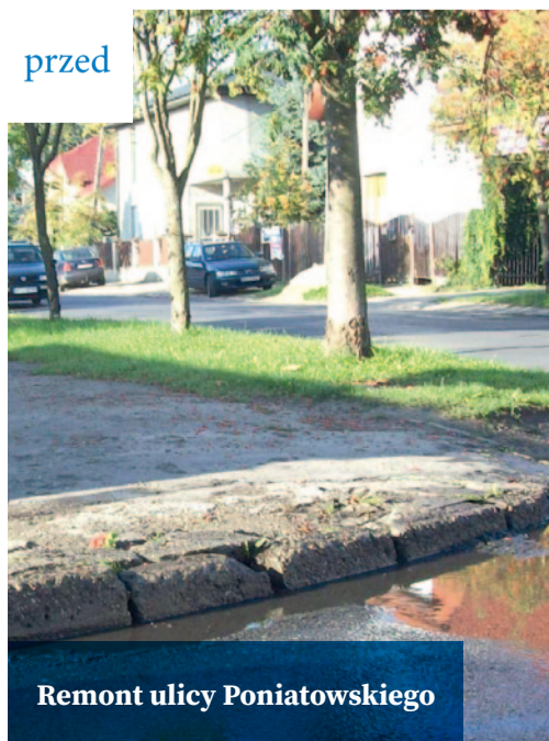
Remont ulicy Poniatowskiego