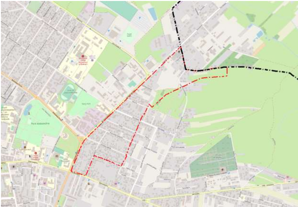
Rys. 5.1-1. Położenie obszaru sporządzanego planu miejscowego